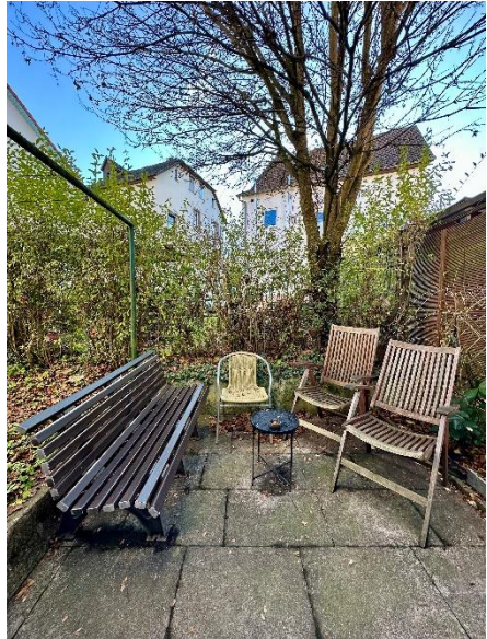
Sitzecke der Wohngruppe im Garten

Mehr Mitarbeiter wären sicherlich positiv und wünschenswert.