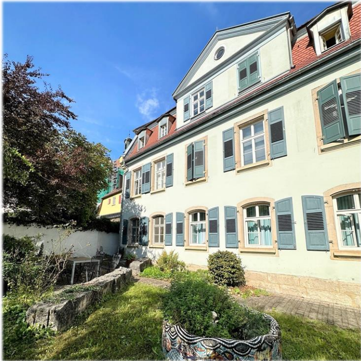
Gemeindepsychiatrie – Hofstatt 7 – 73525 Schwäbisch Gmünd